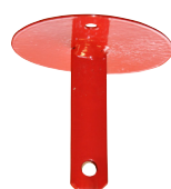
Pulversprinkler 2 kg och 6 kg